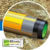
Green Gas Pipes

Eigenverstärktes Hochdruckrohr aus Polyethylen für den Aufbau von zukunftsfähigen Wasserstoffnetzen