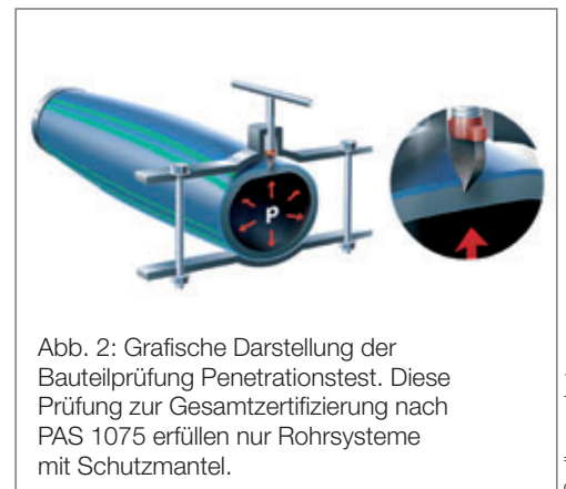
Abb. 2: Grafische Darstellung der Bauteilprüfung Penetrationstest. Diese Prüfung zur Gesamtzertifizierung nach PAS 1075 erfüllen nur Rohrsysteme mit Schutzmantel.

zu den bestehenden Normen- und Richtlinienwerken und beschreibt ein Qualitäts- und Sicherheitsniveau, das über dem der geltenden Normen- und Richtlinienwerke für die Standardverlegung liegt.