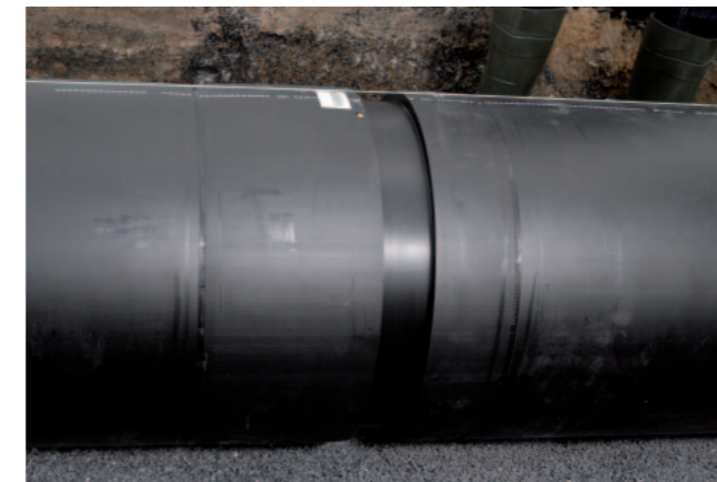
Zusammenstecken der Rohre ohne vorherige spanabhebende Bearbeitung der Rohroberflächen Push-fit and welding without deoxidising