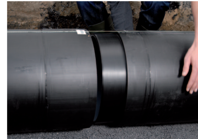
Ausrichten der zu verbindenden egefuse® Rohre Alignment of egefuse® pipes