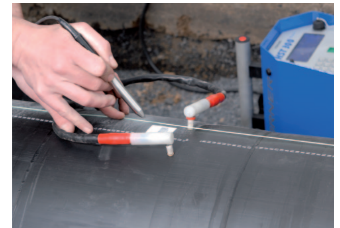
Schweißung mittels handelsüblichen Schweißautomaten Weld with standard welding machines