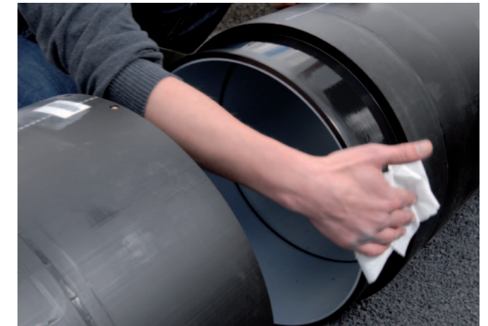
Reinigung der Verbindungsstellen Cleaning of the jointing area